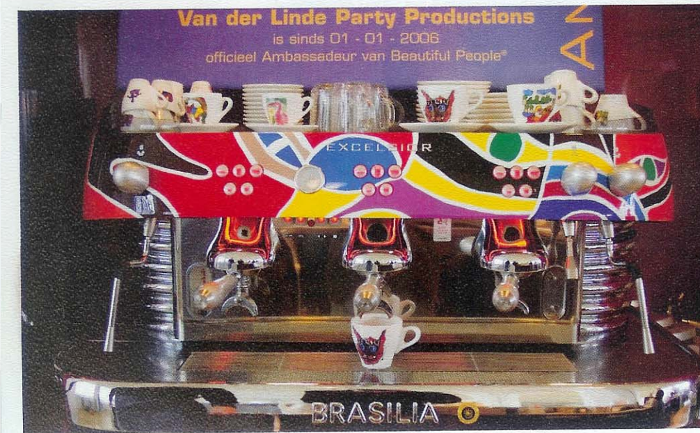
De bont beschilderde espressomachine in het Beautiful People Café.

Caffé Poli levert de koffie binnen 24 uur door heel Nederland. Koffiebonen, gemalen bonen en in sachets. Het zijn 100 procent Arabica's of een mix van Arabica en Robusta, afkomstig uit Brazilië. De horeca betaalt tussen de €8,50 en €13,- voor 1 kilo. Ook importeert het merk de espressomachines van de originele Italiaanse fabrikanten.