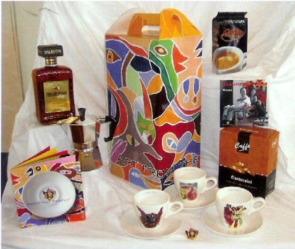
Relatie- en kerstgeschenken in diverse soorten en maten, geschilderd door de schilders van de Herenplaats

De schilders uit de Herenplaats exposeren over de hele wereld en ook in de galerie hangt internationaal werk. De Galerie Atelier Herenplaats zit aan de Schiedamse Vest 56 in Rotterdam. Nadere informatie vind je via www.herenplaats.nl .